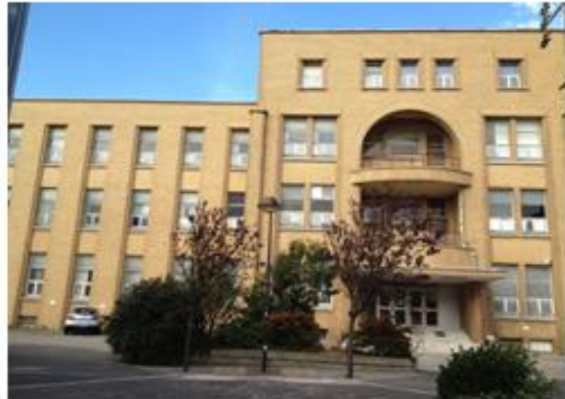
IRFSS Les Hauts de France